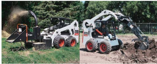
パーチカル(垂直)ブーム (S175/S185/S205)